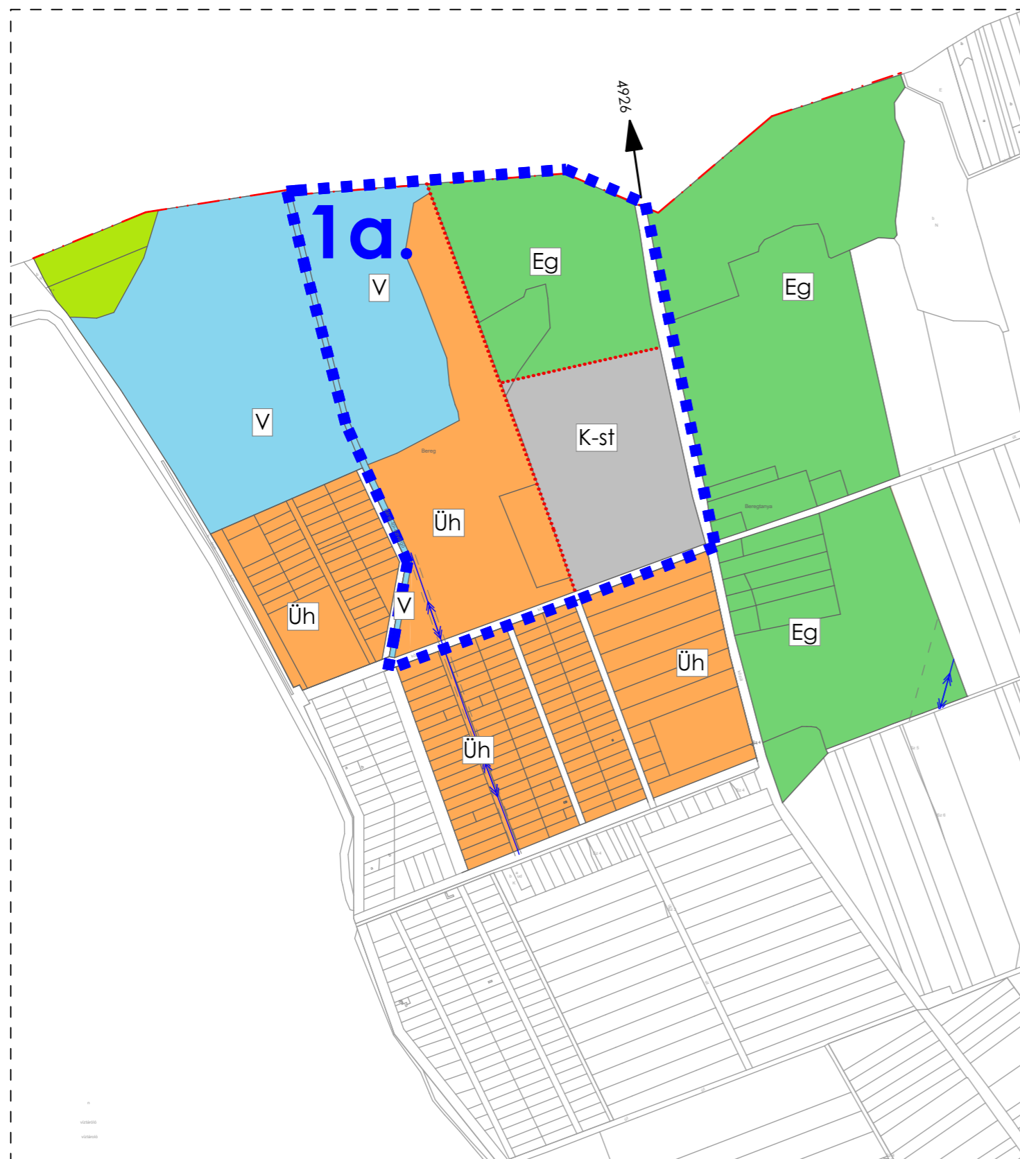
Módosított terv részlete!